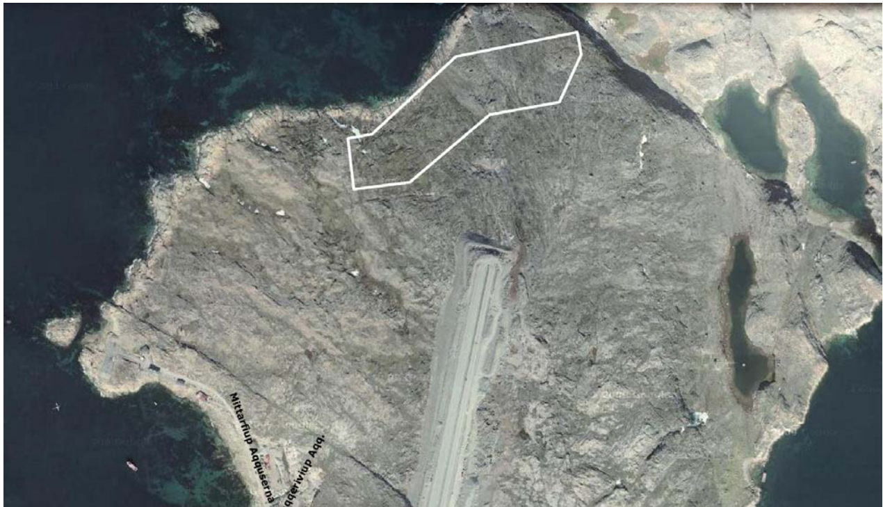
Imm. ilaa B6 | Delområde B6