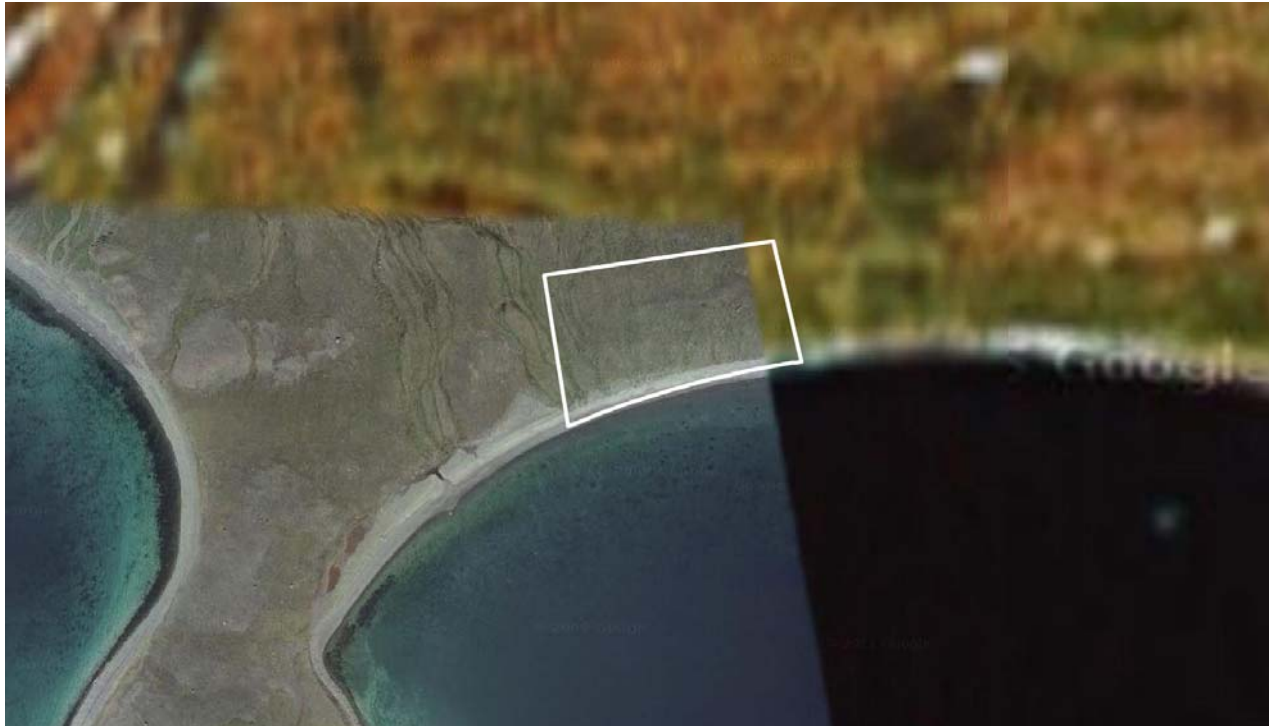
Imm. ilaa B3 | Delområde B3

Der er ikke vejforbindelse til Upernavik Kujalleq. Ved udbygning af området skal der skabes vejforbindelse hertil.