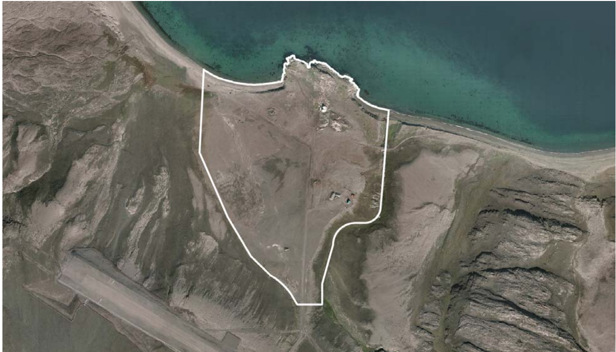
Imm. ilaa B1 | Delområde B1

Transportkommissionen har anbefalet, at der i områdets nordlige del oprettes et nyt havneanlæg til betjening af persontrafik mellem lufthavnen og Uummannaq.