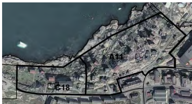
Iluseq 2: Kommunep pilersaarutaanut tapiliut nr. 27-kkut killeqarfimmi killissat nutaat pilersinneqartut titarnerit atasuinnaat takutippaat.

De eksterende rammeafgrænsninger fremgår af figur 1 og de nye rammeafgrænsninger fremgår af figur 2.