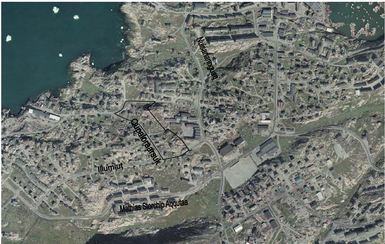
Piffiup pilersaarusiortiusup eqqaa / Lokalplanens område

Derudover kan eksisterende bebyggelse i området udvides og ombygges, såfremt de gældende afstandsregler i det til enhver tid gældende bygningsreglement overholdes.